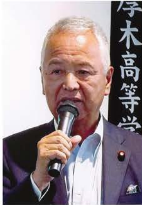
甘利明衆議院議員