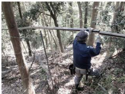
獣害防止柵の点検・保守にボランティアとして参加