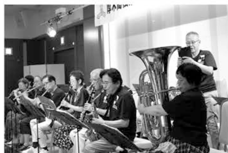
ウィンドオーケストラの演奏

4年に一度の開催計画をしていた2年前はコロナ禍で予約会場のホテルキャンセル、延期となった今回の開催、6年も経つと後期高