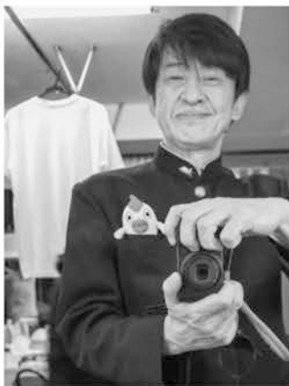
キャラクターのチェック