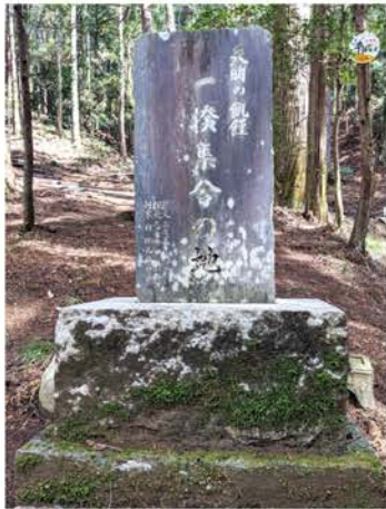
天明の飢饉一揆集合の地