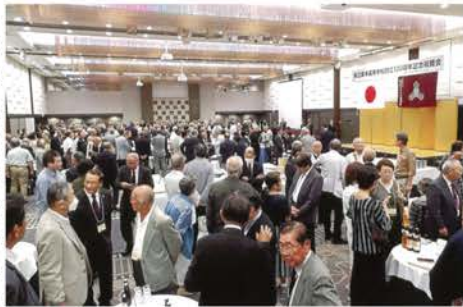
同窓生らでにぎわう記念式典会場