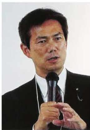
後藤祐一衆議院議員