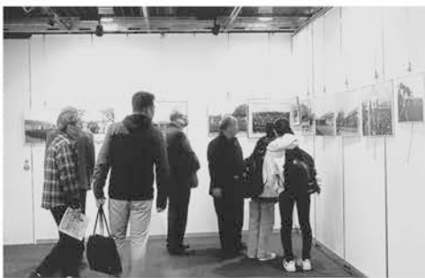
アミューあつぎギャラリィの写真展・絵画展