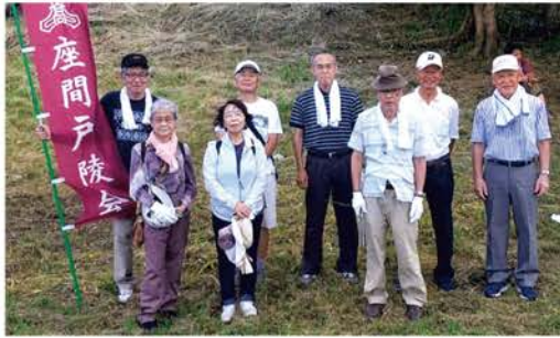
相模川クリーンキャンペーン参加者

クリーン作戦終了後は、参加者8名全員が市内のそば処「尾張屋」に移動し、気持ちよい汗にビールで乾杯!楽しい時間を過ごすことができました。