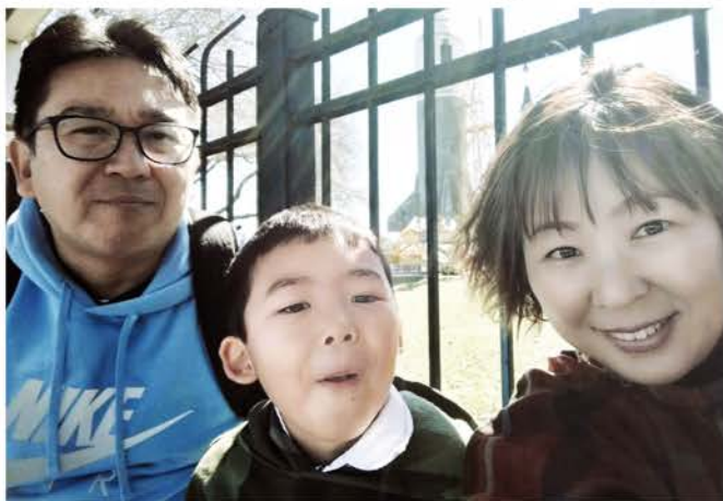
NASA宇宙センターにて

ヒューストンは、完全な車社会で、公共交通機関や徒歩の移動は殆どなく、しかも全米銃所有率ナンバー1と、日本人からすると、全く馴染みがない生活環境で、しかも、ネイティブイングリッシュの中でと、まさに七転八倒の対応