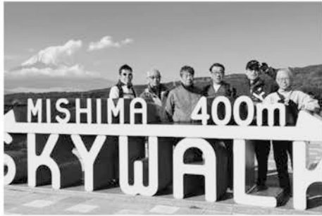
三島スカイウォークにて