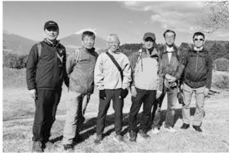
依知・厚木戸陵会のメンバー