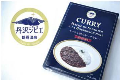
鶴巻温泉発、丹沢のイノシシ肉のレトルトカレー