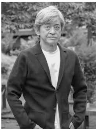
劇団近くの公園にて

のため海老名市文化会館です。その後、紀伊國屋ホールです。お待ちしております。最後に、この年になってつくづく想うのです。「オレ・・・厚高でよかった・・・」